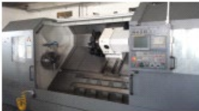
DMC-DL-45-LM Fanuc Series oi-TD