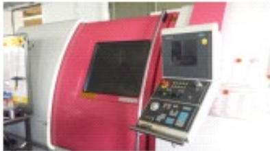
CTX 500 Heidenhain CNC Pilot 3190