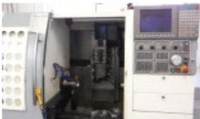
Müga XP 42 Fanuc-Mitsubishi Typ B