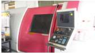
CTX 500 Heidenhain CNC Pilot 3190