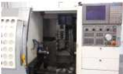
Muga XP 42 Fanuc-Mitsubishi Typ B