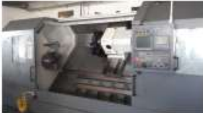
DMC-DL-45-LM Fanuc Series oi-TD